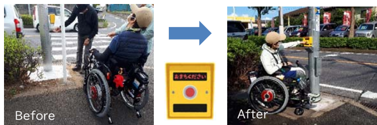
▲植え込みと白いポールを無くすことで車椅子の置き場を確保し、ボタンの角度を変更

信号機の管轄は県の警察、歩道は市の管轄なので、最初に県警を訪問して内容を伝えました。「ボタンの高さを変えるのは難しい。そばにある道路標識を移設して車いすのスペースを作りたい。また、千葉市にツツジを数株抜いてもらえば、スペースが確保できるのではないか」とアイデアも提示されました。それにしたがって信号機工事が行われ、千葉市の若葉土木事務所がツツジを抜き、舗装をやり直しました。